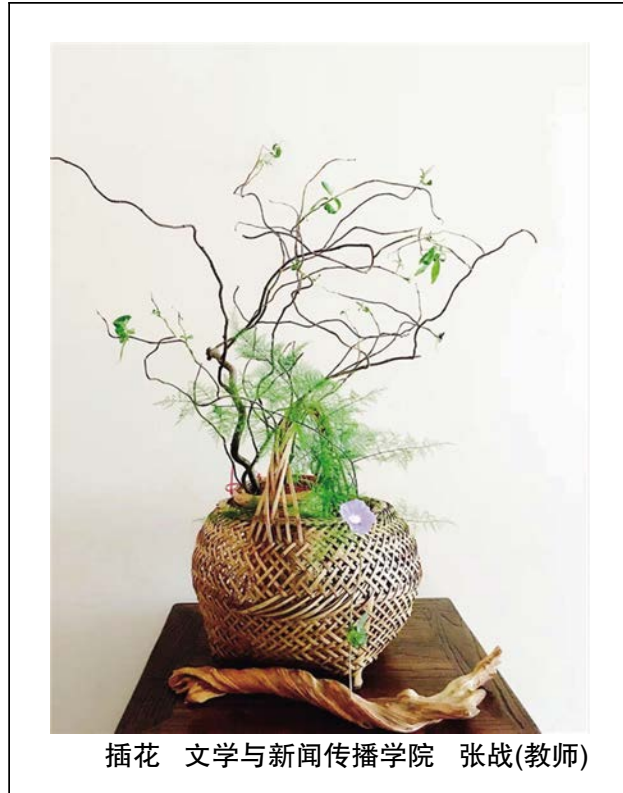
插花 文学与新闻传播学院 张战(教师)

叔、阿姨,他们辛勤劳动,让我们城市的环境变得更好,变得更加美丽;在马路上执勤的交警叔叔,为了让交通不出现问题,在道路上洒下了辛勤的汗水,让城市变得更有秩序;在马路上修剪一劳花草树木的叔叔,推着沉重的机器,一下下地修剪,让城市变得更加漂亮。他们又何必不是以自己的方式,为社会做出贡献,散发着“阳光”呢?我的生活中也充满了“阳光”。我和同学们都经常参加志愿者活动,有帮图书馆整理书籍,去敬老院看望老爷爷老奶奶,打扫学校或者学校外的道路等等。帮助别人,保护环境,我们都在用自己的方式,尽力而为地为大家、为社会做出贡献,所以我們也是在散发着“阳光”呀!“发光并非太阳的专利,你也可以发光。”让我们和这些人一样,生如阳光,用自己的方式,尽力而为地散发“阳光”吧!