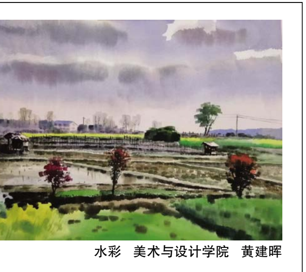
水彩 美术与设计学院 黄建晖

我知道她看懂了,但是那又有什么用呢?该离开的人总会离开,就像是康老师还有后来的我,那天风呼呼地吹,康老师说那是她专门托人邮寄过来,翻了好几座山才拿到的,风灌进我的眼睛里,我记不太清她说的话了,“拿着,给你买的,这叫马克笔,你用它可以画出最漂亮的。”我低下头,躲过这阵讨厌的风,“还是不要了,以后我再画画。”“为什么?”风在我的眼睛里肆虐,我转过轮椅,“不为啥……”是来学校不方便吗?没关系,我可以去你家呀。”我用力用手揉了揉眼睛,不是的,和您没关系。”“总有原因的,你说出来,我帮你解决。”“不知道为什么风越来越大了,我快睁不开眼睛了。”“不用了,真的不用了。”“不是因为你爸爸,如果是的……”“不是的,您就别再问了,别再问了。”我红着眼睛,想用眼泪把风逼出来,却怎么也不管用,好像是倒着流进了心窝里,一点一滴滚烫的,我看着老师一点一点远去的身影,一片叶子就这样直直的落在我的腿上,没有一点声响。